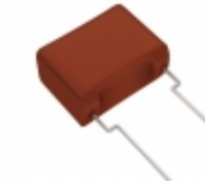
ECW-FA2J155JQ Panasonic Electronic Components CAP FILM 1.5UF 5% 630VDC RADIAL