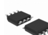
ATA6560-GAqw Microchip Technology IC TXRX CAN NSIL 8SO