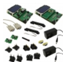
ATA6286-EK3 Microchip Technology EVAL ACTIVE RFID 125KHZ+433MHZ