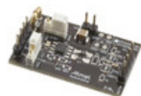
ATA6560-EK Micrel / Microchip Technology EVAL BOARD FOR ATA6560