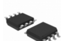
ATA6560-GAqw-N Micrel / Microchip Technology INDUSTRIAL GRADE CAN TRX WITH NS