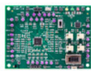
AD8452-EVALZ ADI (Analog Devices, Inc.) ANALOG FRONT END