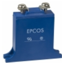
B72240B0750K001 EPCOS VARISTOR BLOCK 75VRMS 40MM