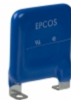
B72240L0151K100 EPCOS VARISTOR 240V 40KA CHASSIS