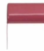
ECQ-E4225KZ Panasonic Electronic Components CAP FILM 2.2UF 10% 400VDC RADIAL