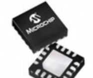
PIC16LF1825-E/JQ Microchip Technology IC MCU 8BIT 14KB FLASH 16UQFN