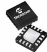
PIC16LF1824T-I/JQ Microchip Technology IC MCU 8BIT 7KB FLASH 16UQFN