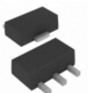
MCP1700T-2902E/MB Microchip Technology IC REG LDO 2.9V 0.25A SOT89-3