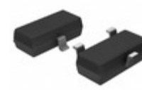
MCP1700T-2702E/TT Microchip Technology IC REG LDO 2.7V 0.25A SOT23-3