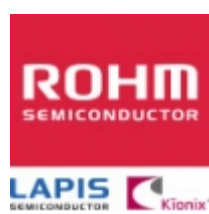
2SCR552PFRA ROHM 2SCR552PFRA ROHM