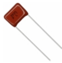
ECQ-P1H393GZ Panasonic Electronic Components CAP FILM 0.039UF 2% 50VDC RADIAL