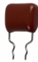
ECQ-P1H433FZW Panasonic Electronic Components CAP FILM 0.043UF 1% 50VDC RADIAL