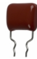
ECQ-P1H393FZW Panasonic Electronic Components CAP FILM 0.039UF 1% 50VDC RADIAL