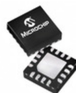
PIC16LF15324-E/JQ Microchip Technology IC MCU 8BIT 7KB FLASH 16UQFN