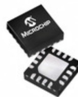
PIC16LF15324-I/JQ Microchip Technology IC MCU 8BIT 7KB FLASH 16UQFN