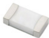
0437003.WRA Hamlin / Littelfuse FUSE BRD MNT 3A 32VAC/35VDC