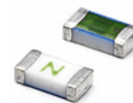
0437.750WR Littelfuse Inc. FUSE BOARD MOUNT 750MA 63VAC/VDC