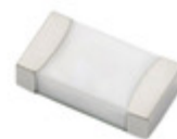
0437.750WRA Hamlin / Littelfuse FUSE BRD MNT 750MA 63VAC/VDC