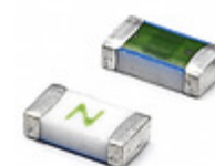
0437001.WR Littelfuse Inc. FUSE BOARD MNT 1A 63VAC/VDC 1206