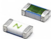
0437003.WR Littelfuse Inc. FUSE BRD MNT 3A 32VAC 35VDC 1206