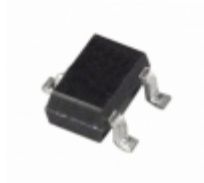
ADM809LAKSZ-REEL7 Analog Devices Inc. IC SUPERVISOR MPU 4.63V SC-70-3