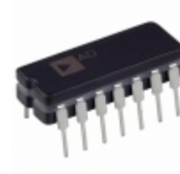
AD713AQ Analog Devices Inc. IC OPAMP JFET 4MHZ 14CDIP