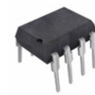
SFH6345-X001 Vishay Semiconductor Opto Division OPTOISOLATOR 5.3KV TRANS 8DIP