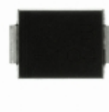
CEFB104-G Comchip Technology DIODE GEN PURP 400V 1A DO214AA