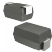
CEFA203-G Comchip Technology DIODE GEN PURP 200V 2A DO214AC