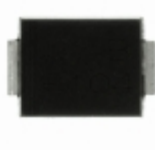
CEFB103-G Comchip Technology DIODE GEN PURP 200V 1A DO214AA