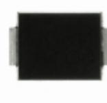
CEFB103-G Comchip Technology DIODE GEN PURP 200V 1A DO214AA