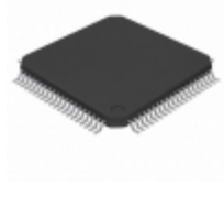
PIC18F85K90T-I/PT Microchip Technology IC MCU 8BIT 32KB FLASH 80TQFP