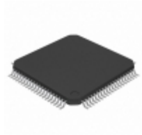
PIC18F85K22T-I/PT Microchip Technology IC MCU 8BIT 32KB FLASH 80TQFP