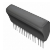
BP5450 Rohm Semiconductor IC DC/DC CONV DUAL VARI SIP18