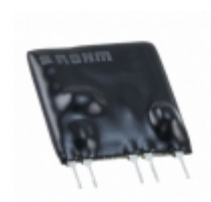
BP5716 Rohm Semiconductor IC AC/DC CONVERTER ISO 5SIP