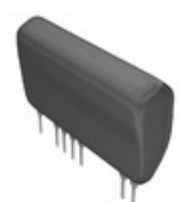
BP5718A12 Rohm Semiconductor AC/DC CONVERTER 12V 1A 12W