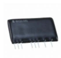
BP5717 Rohm Semiconductor IC AC/DC CONVERTER ISO 12SIP