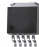
IXDD414YI IXYS IC MOSFET DRVR LS 14A SGL 5TO263