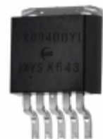
IXDD408YI IXYS IC MOSFET DRVR LS 8A SGL 5TO-263