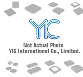
DM74LS74AMX NS DM74LS74AMX NS