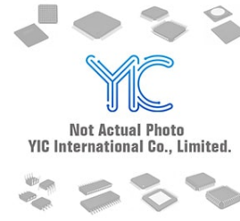
DM74LS645N NS NS DIP20