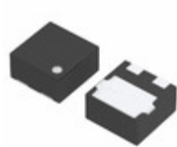
XC6120N492HR-G Torex Semiconductor Ltd IC SUPERVISOR 4.9V 3-USP