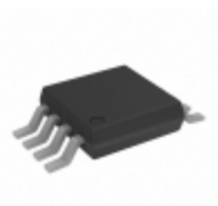
AD8223BRMZ-RL Analog Devices Inc. IC OPAMP INSTR 200KHZ RRO 8MSOP