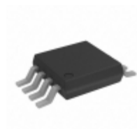
AD8223BRM-R7 Analog Devices Inc. IC OPAMP INSTR 200KHZ RRO 8MSOP