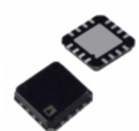
AD8224ACPZ-R7 Analog Devices Inc. IC OPAMP INSTR 1.5MHZ 16LFCSP