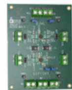
AD8224-EVALZ ADI (Analog Devices, Inc.) BOARD EVALUATION AD8224