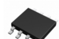
BU7462FVM-TR Rohm Semiconductor IC OPAMP GP 1MHZ 8MSOP