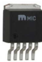
MIC39301-1.8BU Microchip Technology IC REG LDO 1.8V 3A TO263-5