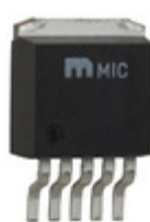
MIC39301-1.8WU Microchip Technology IC REG LDO 1.8V 3A TO263-5