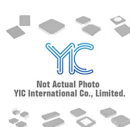
MIC39300-5.0WU MICREL MICREL TO-263