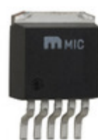
MIC39301-1.8BU TR Microchip Technology IC REG LDO 1.8V 3A TO263-5