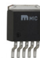
MIC39301-1.65BU Microchip Technology IC REG LDO 1.65V 3A TO263-5