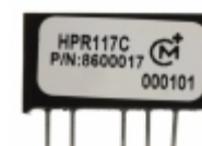
HPR117C Murata Power Solutions Inc. CONV DC/DC +/-15V +/-25MA SIP