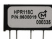
HPR118C Murata Power Solutions Inc. CONV DC/DC 5V 150MA SIP