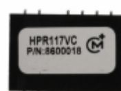
HPR117VC Murata Power Solutions Inc. CONV DC/DC +/-15V +/-25MA DIP