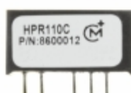
HPR110C Murata Power Solutions Inc. CONV DC/DC +/-12V +/-30MA SIP