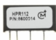
HPR112C Murata Power Solutions Inc. CONV DC/DC 5V 150MA SIP