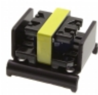
SI-8501L Sanken IC REG BUCK ADJ 1A EI-19