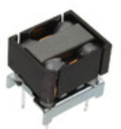
SI-8401L Sanken IC REG BUCK 5V 0.5A EI-12.5