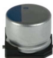
APXA200ARA390MH70G United Chemi-Con CAP ALUM POLY 39UF 20% 20V SMD