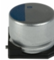
APXA200ARA470MH70S United Chemi-Con CAP ALUM POLY 47UF 20% 20V SMD