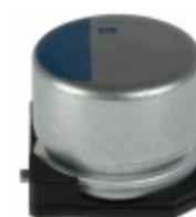
APXA200ARA390MH70S United Chemi-Con CAP ALUM POLY 39UF 20% 20V SMD