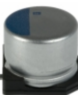
APXA200ARA470MH70G United Chemi-Con CAP ALUM POLY 47UF 20% 20V SMD