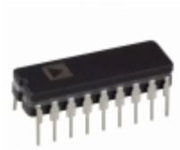
AMP01FX Analog Devices Inc. IC OPAMP INSTR 570KHZ 18CDIP