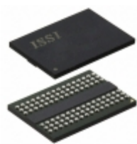
IS46TR16128BL-125KBLA2-TR ISSI, Integrated Silicon Solution Inc IC SDRAM 2GBIT 800MHZ 96BGA