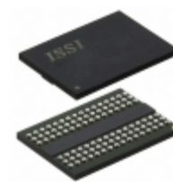
IS46TR16128C-125KBLA1 ISSI, Integrated Silicon Solution Inc IC SDRAM 2GBIT 800MHZ 96BGA