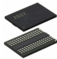
IS46TR16128BL-15HBLA2 ISSI, Integrated Silicon Solution Inc IC SDRAM 2GBIT 667MHZ 96BGA