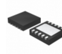
MCP4652T-502E/MF Microchip Technology IC DGTL POT 5K 257TAPS 10-DFN