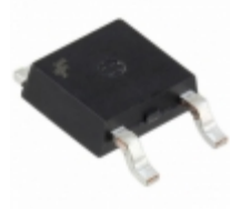
KSH44H11TF AMI Semiconductor / ON Semiconductor TRANS NPN 80V 8A DPAK