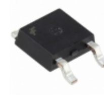
KSH44H11TM Fairchild/ON Semiconductor TRANS NPN 80V 8A DPAK