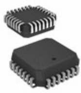
DG407DN-T1-E3 Electro-Films (EFI) / Vishay IC MULTIPLEXER 16X1 28PLCC