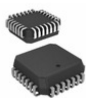
DG407DN-T1 Electro-Films (EFI) / Vishay IC MULTIPLEXER 16X1 28PLCC