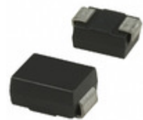
SMBJ58A Fairchild/ON Semiconductor TVS DIODE 58VWM 93.6VC SMB