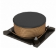
AX97-404R7 Triad Magnetics FIXED IND 4.7UH 9.3A 10 MOHM