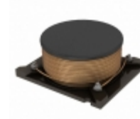
AX97-40471 Triad Magnetics FIXED IND 470UH 930MA 700 MOHM