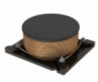
AX97-40680 Triad Magnetics FIXED IND 68UH 2.5A 110 MOHM