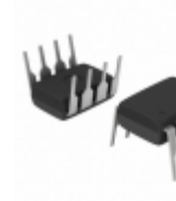
TC4428EPA Micrel / Microchip Technology IC MOSFET DVR 1.5A DUAL HS 8-DIP