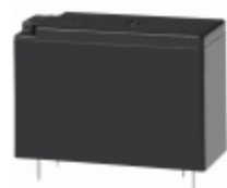
JW2SN-DC18V Panasonic Electric Works RELAY GEN PURPOSE DPDT 5A 18V