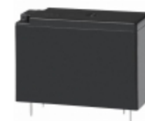
JW2SN-DC9V Panasonic Electric Works RELAY GENERAL PURPOSE DPDT 5A 9V