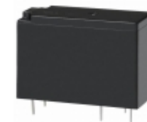
JW2SN-B-DC5V Panasonic Electric Works RELAY GENERAL PURPOSE DPDT 5A 5V