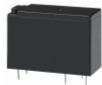
JW2SN-B-DC6V Panasonic Electric Works RELAY GENERAL PURPOSE DPDT 5A 6V