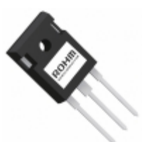
RGW00TS65DGC11 LAPIS Semiconductor 650V 50A FIELD STOP TRENCH IGBT