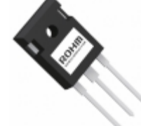
RGW00TS65GC11 LAPIS Semiconductor 650V 50A FIELD STOP TRENCH IGBT