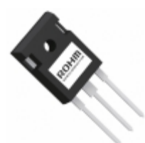
RGW60TS65GC11 LAPIS Semiconductor 650V 30A FIELD STOP TRENCH IGBT