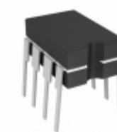
TC1044SMJA Microchip Technology IC REG SWITCHD CAP INV 8CDIP