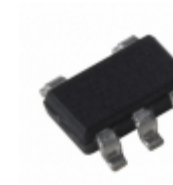
MIC5317-2.5YM5-T5 Microchip Technology IC REG LDO 2.5V 0.15A SOT23-5