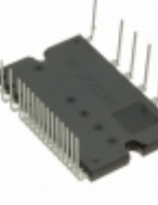
BM63763S-VA Rohm Semiconductor IC IPM 600V IGBT SW 25HSDIP