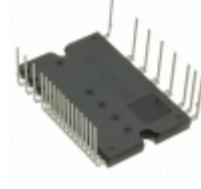
BM63763S-VC Rohm Semiconductor IC IPM 600V IGBT SW 25HSDIP