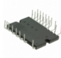
BM63764S-VC Rohm Semiconductor IC IPM 600V IGBT SW 25HSDIP