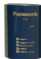
ECE-P1HP563HA Panasonic Electronic Components CAP ALUM 56000UF 20% 50V SNAP