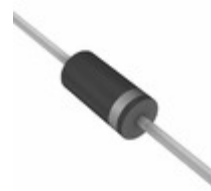
BZW06-13 A0G TSC (Taiwan Semiconductor) TVS DIODE 12.8V 27.2V DO204AC