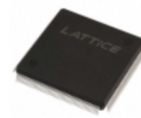
LFEC10E-5QN208C Lattice Semiconductor Corporation IC FPGA 147 I/O 208QFP