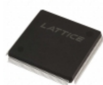
LFEC10E-5Q208C Lattice Semiconductor Corporation IC FPGA 147 I/O 208QFP