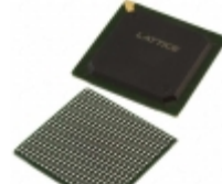
LFEC10E-4FN484I Lattice Semiconductor Corporation IC FPGA 288 I/O 484FBGA