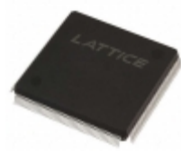
LFEC10E-4Q208I Lattice Semiconductor Corporation IC FPGA 147 I/O 208QFP