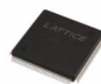
LFEC10E-4QN208C Lattice Semiconductor Corporation IC FPGA 147 I/O 208QFP