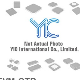
BD8158FVM-GTR ROHM BD8158FVM-GTR ROHM