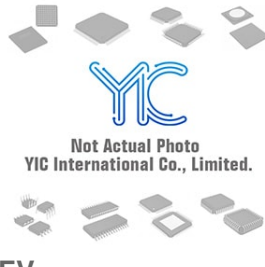
BD8160EFV ROHM BD8160EFV ROHM