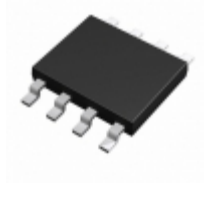
BD8152FVM-TR LAPIS Semiconductor IC REG BST SEPIC ADJ 1.4A 8MSOP