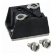
VS-T70HFL10S05 Electro-Films (EFI) / Vishay DIODE GEN PURP 100V 70A D-55