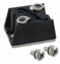
VS-T70HFL10S10 Electro-Films (EFI) / Vishay DIODE GEN PURP 100V 70A D-55