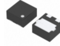
XC6120C242HR-G Torex Semiconductor Ltd. IC SUPERVISOR 2.4V 3-USP