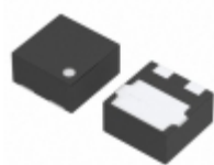
XC6120C232HR-G Torex Semiconductor Ltd. IC SUPERVISOR 2.3V 3-USP