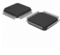
CS5376A-IQZ Cirrus Logic IC FILTER DGTL MULTI-CH 64-TQFP