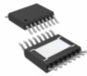
LT3012EFE#TRPBF Linear Technology IC REG LDO ADJ 0.25A 16TSSOP