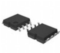
BR93G76F-3GTE2 LAPIS Semiconductor MICROWIRE BUS 8KBIT(512X16BIT) E