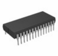
AT28C256F-15DM/883 Micrel / Microchip Technology IC EEPROM 256K PARALLEL 28CDIP