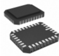
AT28C256E-25LM/883 Microchip Technology IC EEPROM 256KBIT 250NS 32CLCC