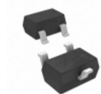
BSS138W L6433 Infineon Technologies MOSFET N-CH 60V 280MA SOT-323